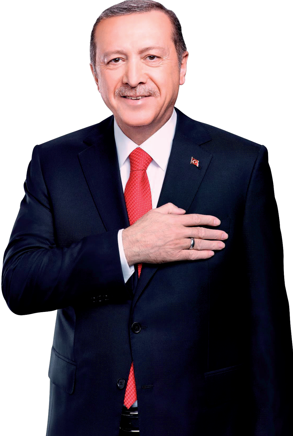
RECEP TAYYİP ERDOĞAN CUMHURBAŞKANI