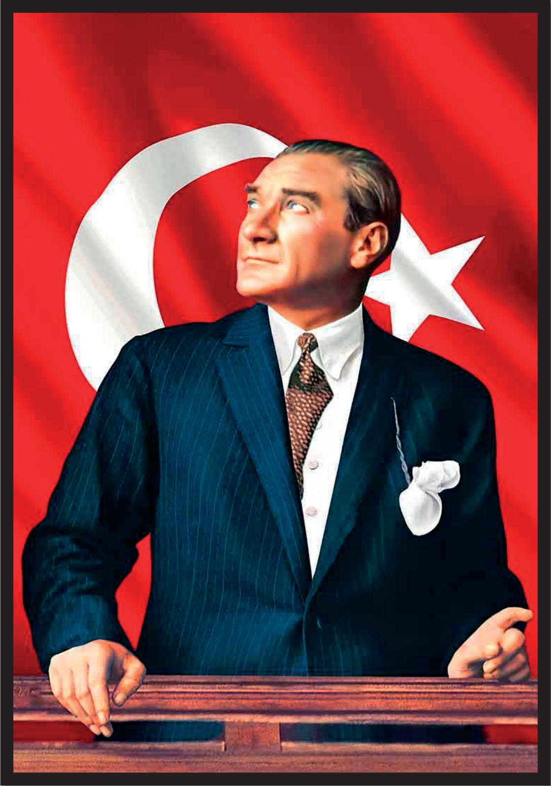
GAZİ MUSTAFA KEMAL ATATÜRK