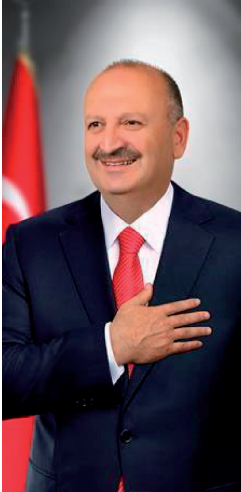
HÜSEYİN TAVLI BELEDİYE BAŞKANI